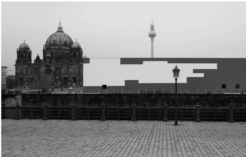
Temporary Kunsthalle Berlin, 2007-2008