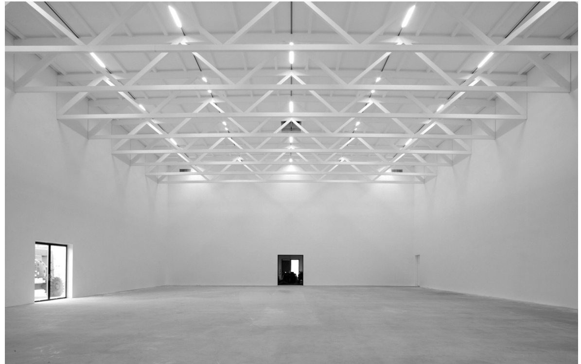
Temporary Kunsthalle Berlin, 2007-2008