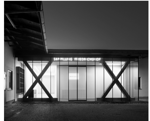
Sammlung Friedrichshof, Zurndorf, Austria Renewal and extension