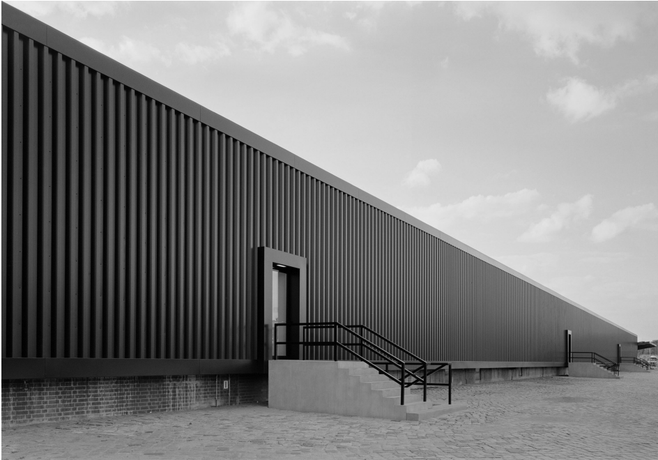
Friedrich Christian Flick Collection Extension museum of contemporary art Commission: Stiftung Preussischer Kulturbesitz Berlin 2004