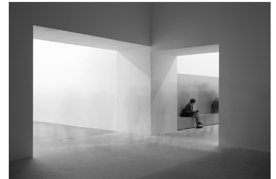
Documenta 11 Warehouse conversion and exhibition venues Commission: Documenta / Museum Fridericianum GmbH, Kassel 2002

S.Malvezzi, W. Kuehn (Estratto da "Towards an Invisible Architecture", in Domus 913, April 2008)