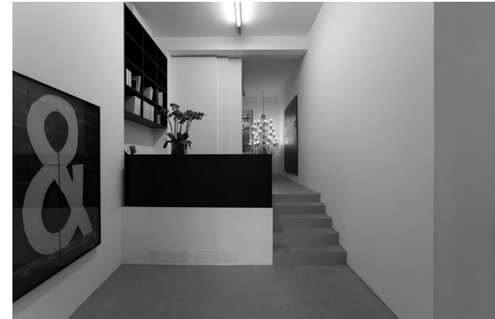
Galleria Kaufmann Repetto Milano, 2010