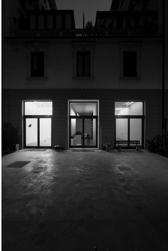
Galleria Kaufmann Repetto- Milano, 2010 Cortile d'ingresso.